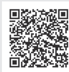
最近のセッションの状況

UNU-IASは、国連アジア太平洋経済社会委員会 (UNESCAP)、国連人間居住計画 (UN-Habitat) などとの協働の連携のもと、2019年から「持続可能な都市開発のための首長アカデミー」として、持続可能な都市開発に取り組むアジア太平洋地域の首長に対し、都市計画や財政などに関する協働学習・トレーニングの機会を提供している。2020年2月に開催された第10回世界都市フォーラムでのセッションでは、首長が各都市における成果を発表し、開発資金の枠組や都市の変革に向けた技術とイノベーションについて国際機関や企業の関係者と議論を行った (写真)。