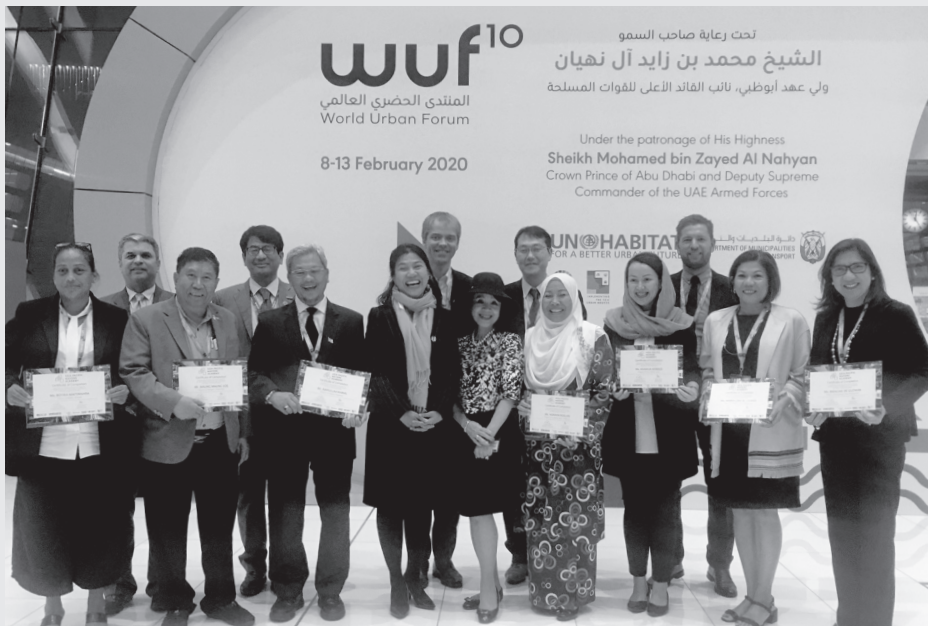
第10回世界都市フォーラムのセッションにて