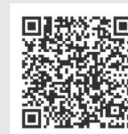
COP26 サイドイベントの詳細

今後もこれらの研究や取り組みを進め、政策の立案、予算化、実施、モニタリング評価などの効果的なガバナンスのあり方について知見を提供し、脱炭素化とSDGsの達成という世界の重要課題に貢献することを目指していく。