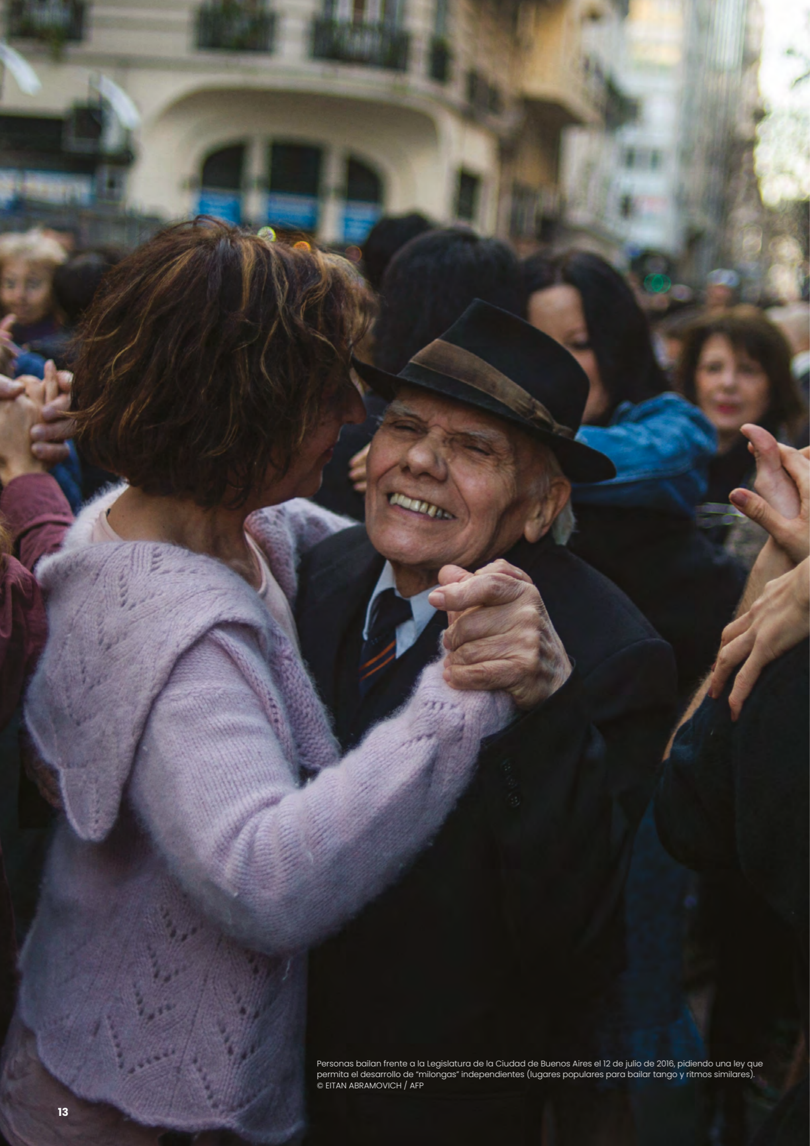
Personas bailan frente a la Legislatura de la Ciudad de Buenos Aires el 12 de julio de 2016, pidiendo una ley que permita el desarrollo de "milongas" independientes (lugares populares para bailar tango y ritmos similares).

En segundo lugar, el Consejo Asesor de Medio Ambiente y Desarrollo Sostenible, creado en 2020, reúne a más de 30 organizaciones de la sociedad civil y emprendedores, especialmente organizaciones lideradas por jóvenes. La función del consejo es formular recomendaciones para ser consideradas por la Secretaría de Medio Ambiente para el desarrollo de políticas públicas en temas relevantes.