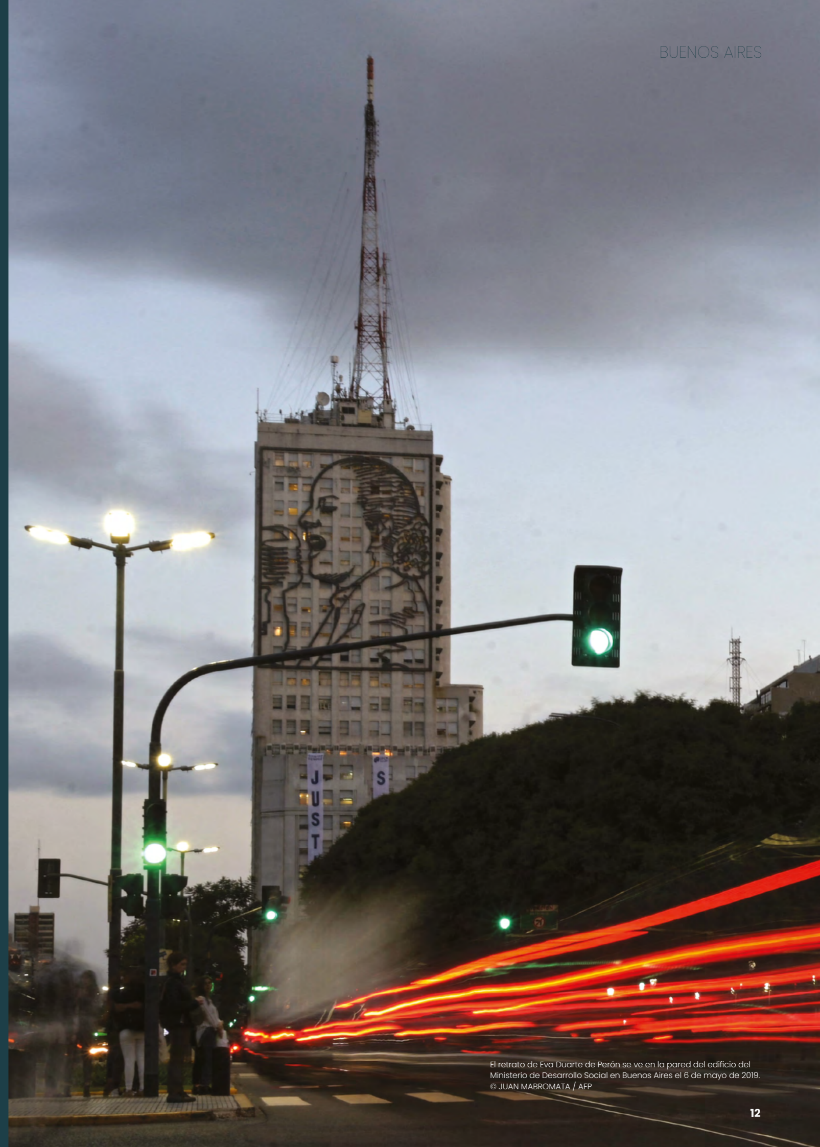
El retrato de Eva Duarte de Perón se ve en la pared del edificio del Ministerio de Desarrollo Social en Buenos Aires el 6 de mayo de 2019.