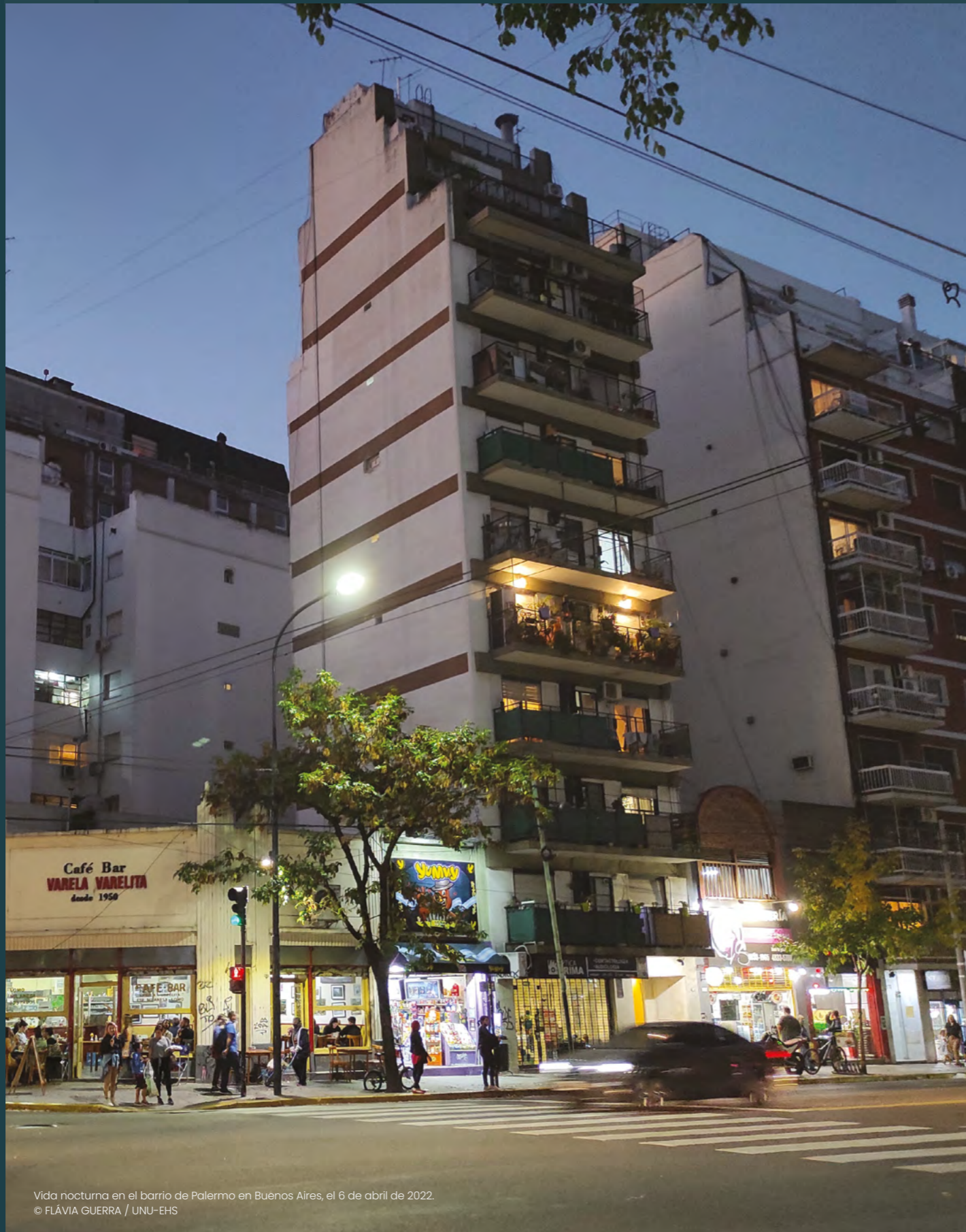
Vida nocturna en el barrio de Palermo en Buenos Aires, el 6 de abril de 2022.