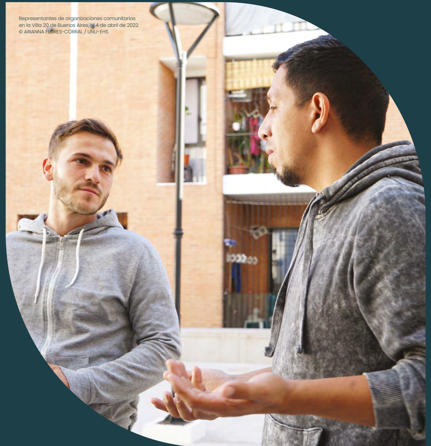
Representantes de organizaciones comunitarias en la Villa 20 de Buenos Aires, el 4 de abril de 2022.

La lucha contra el cambio climático requiere enfoques integrados de adaptación y mitigación que pongan a los más vulnerables en el centro.