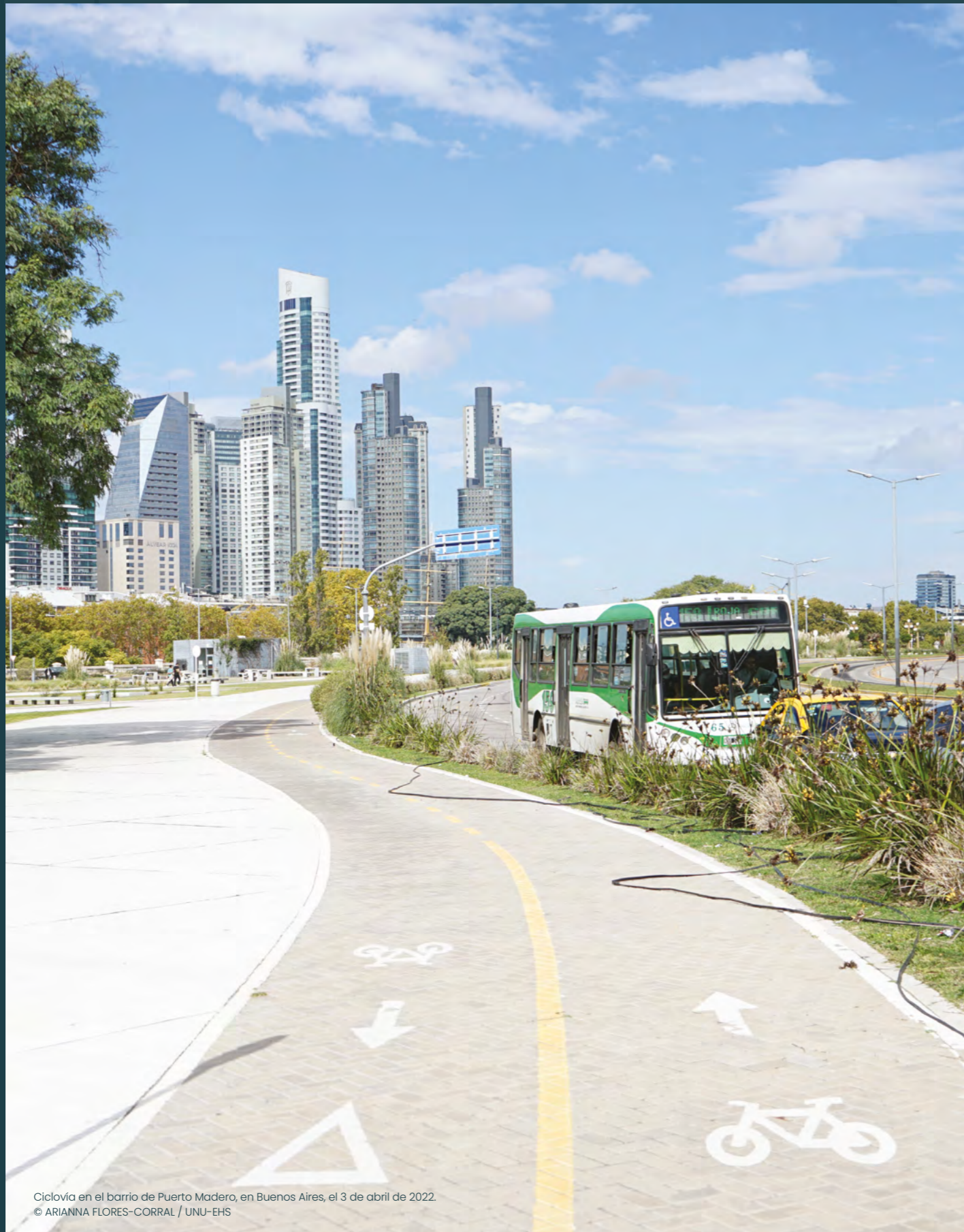
CicloVía en el barrio de Puerto Madero, en Buenos Aires, el 3 de abril de 2022.